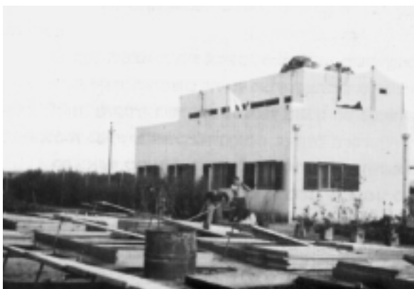
משק הפועלות בגן-מגד (תרצ"ה)

כל אחת מאיתנו נושאת בקירבה תכנית חיים לעתידה שאולי גם קשורה בהרבה עם עתיד התנועה שאולם נדחית מפני שאלת המשק. ומכאן - הרינו בין המיצרים, אין כל התקדמות ממשית בארגון המשק ואין אפשרות להוציא לפועל שאיפות הפרט. אין זכות קיום לקבוצה, מכיוון שאין סימני משק ואין אפשרות להשתחרר ממנה, מכיוון שמרגישות אנו אחריות רבה כלפי הרעיון. 93