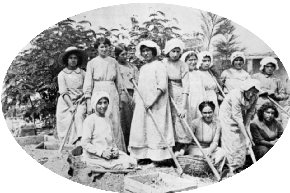
תלמידות בחוות העלמות בכינרת (1918)

יחסו של הפועל הדתי לסוגיית ההכשרה החקלאית לפועלות הדתיות שיקף את יחסו לאישה בכלל. חברי הפוהמ"ז ביקשו לשכלל את כישורי האישה במשפחתה לשם השגת היעדים החדשים: (א) הנחלת ערכי התנועה לדורות הבאים – לאישה-האם חשיבות רבה בתחום חינוך הילדים, ולפיכך ניתן לה תפקיד מרכזי בהנחלת מורשת הפוהמ"ז. 17 (ב) השתתפות בבניין הארץ ועמידה לימין החבר במשק – התפיסה הייתה כי אשת החבר בהתיישבות החקלאית חשובה למלחמת הקיום של המשפחה יותר