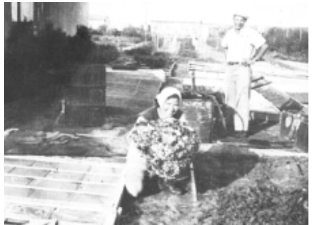
במשתלת הפרחים במשק גן-מגד

הנהלת המשק; הפיקוח וההדרכה על המוסד היו בידי הוועד הפועל של הפוהמ"ז, והוא ייצג את המשק בפני המוסדות הציוניים. מטעם הפוהמ"ז טיפלה במשק ישירות 'מועצת הפועלות הדתיות'. 115 ההנהלה הציונית, שהייתה מעורבת במשק 'ברוריה', וכן ויצ"ו לא היו מעורבות בנעשה במקום לבד מתמיכתן הכספית. מבחינת הפועלות טובה דיאמנד-סנהדראי הייתה האפוסטרופסית על המשק. 116