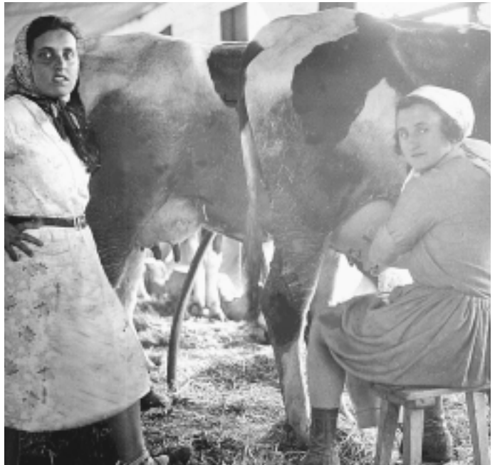
תלמידות בבית הספר החקלאי בנהלל (1932)

ה. חשיבות הפועלת-האם-המחנכת בעיצוב דמות הדור הבא - בשנות השלושים, לאחר שהתגברו על קשיי בראשית, הוברר לכול כי ההתיישבות הדתית, בדומה להתיישבות הכללית, זקוקה לדור המשך שילך בדרכי המייסדים. האישה נתפסה כעמוד התווך של המשפחה וכמעצבת דמות הבית כולו - הפרטי והכללי. היה מובן מאליו שיש צורך בנשים שספגו את ערכי התנועה ואת יחסה להתיישבות החקלאית, נשים שיחנכו את הבנים ברוח תורה ועבודה. 84