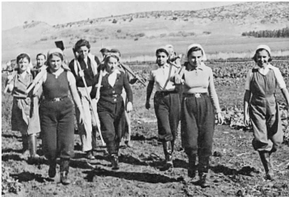
נערות מעליית הנוער ממרכז אירופה בנהלל (שנות השלושים)

שיכשיר את התְּבָרָה לחיים המבוססים על רעיון תורה ועבודה. בשנות השלושים בלטה כבר בקרב החברות הודעות אישית מובהקת עם מטרות הכללי, שהתבטאה בשאיפה המרכזית לקחת חלק מעשי במפעל התחייה. היו גם שציינו כי ביקשו להסתייע במשק על מנת לממש מטרות אישיות. לטענתן רק במשק פועלות יכלו לממש את שאיפותיהן בדבר קירבה לטבע, עבודת כפיים ועיסוק יצרני היכול לתרום למפעל הציוני, שכן בכל קבוצה מעורבת היו נשלחות לעסוק בעבודות המטבח או בניקיון. אך במשק הייתה אפשרות להשתתף בבניין הארץ ולחוש גם את בניין הפרט. 79