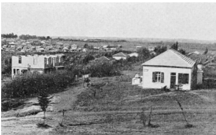
המושבה עין-גנים (1930)

שני גורמים חברו יחד להקמת משק הפועלות 'גן-מגד': 'ארגון הפועלות הדתיות', שהוקם בינואר 1935 וסחף את תנועת הפוהמ"ז לניסיון הנוסף, וחלוצות דתיות חדורות הכרה מגובשת בדבר ייעודן