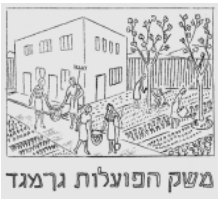
רישום מתוך עלון המשק (יוני 1938)

שיקלוט 50-60 חניכות. החניכות יקבלו בו הכשרה מקצועית יסודית בכל ענפי המשק החקלאי, וייש לקוות כי המוסד הזה כשיקום על תילו, יוכל למלא את תפקידו לחנך ולהכשיר הכשרה חקלאית, נפשית ורוחנית את הבחורה הדתית לקראת השתרשותה והתאחוותה בהתיישבות החקלאית הדתית. 110 ואכן ייעודו המרכזי של המשק היה הכשרת החברות למילוי תפקידן במפעל התנועה. מטרה זו הייתה מרכזית בעיני תנועת הפוהמ"ז ו'מועצת הפועלות הדתיות' כאחד. מרבית הפועלות במשק לא חשו שהן חוללו מהפכה מבחינה אישית במהלך השתייה בו. לאחר שנים הודו כי היה במשק פוטנציאל ליצירת דמות חדשה, אך הוא לא מומש בהעדר יד מכוונת. 111 המשק הביתי והחקלאי: הפועלות במשק קיבלו הכשרה חקלאית בגידול ירקות ופרחים ובמשק בית. בשנים שחלפו מאז הקמת משק 'ברוריה' גברה ההכרה בחשיבות ההכשרה למשק בית, זאת בשל