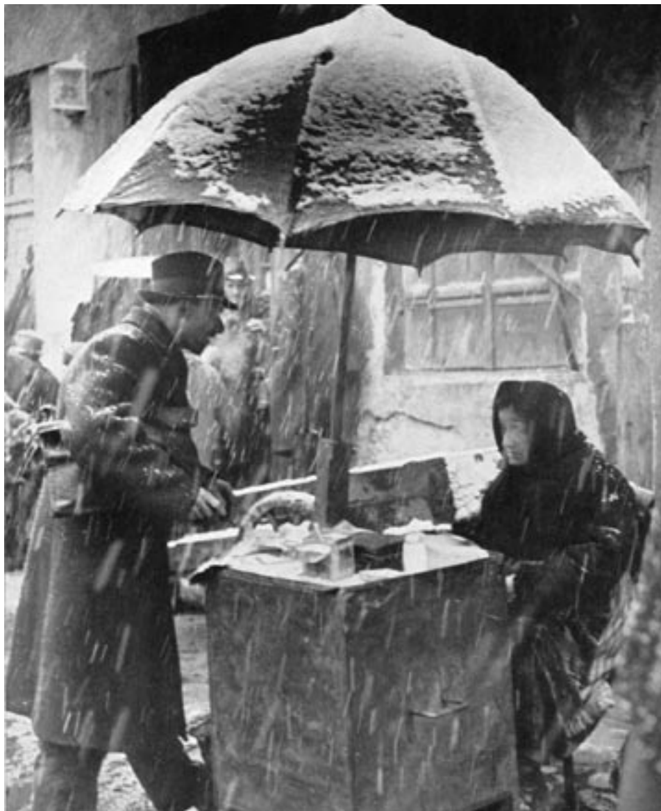
רוכלת יהודייה וגובה המסים ביום חורפי בקרקוב; שנות השלושים של המאה העשרים

כדומה לרחל בירמאן דאגו נשים רבות בתחום המושב לענייני הבית ובה בעת ניהלו את העסק המשפחתי יחד עם הבעל ולעתים בלעדיו. לא אחת נאלצו רוכלים וסוחרים זעירים לצאת את גבולות עיירתם ולהציע את מרכולתם בעיירות רחוקות. במקרים אלה נפלו על כתפי האישה הטיפול במשק הבית ובילדים והדאגה לעסק בעת היעדרותו של הבעל. בספרו 'אנשי נבו' ציין שמעון קושניר שאביו של נח נפתולסקי – אחת הדמויות הידועות של העלייה השנייה החלוצית – נהג לצאת מביתו בראשית השבוע ולחזור בסופו. בהיעדרו הפכה האם סימה-ביילה למפקחת החולשת על כל ענייני