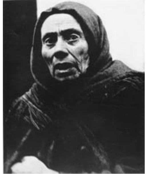
זקנה יהודייה בורשה; שנות השלושים של המאה העשרים

לנשים, ששיעורן באוכלוסייה היהודית היה גבוה מזה של הגברים, היה חלק חשוב במבנה התעסוקה של האוכלוסייה היהודית בתחום המושב. 16 תהליך התיעוש, שחולל כאמור תמורות ממשיות במבנה התעסוקה של היהודים, הביא לשינוי גדול במיוחד בקרב הנשים היהודיות והכניס אותן למעגל העבודה. הסטטיסטיקות הנוגעות לנשים עובדות בתחום המושב מצביעות על כך שלאישה היה תפקיד מרכזי בכלכלת המשפחה. 21 אחוז במוצע מהנשים בתחום המושב מגיל ארבע-עשרה עד חמישים ותשע התפקדו במפקד האוכלוסין בשנת 1897 כמועסקות. ואולם הכלכלן ארקדיוס קאהן טען ששיעור הנשים העובדות בפועל היה גבוה יותר. לטענתו המפקד לא כלל נשים שעבדו בבתי מלאכה קטנים ומשפחתיים ועסקים זעירים שבהם לקחו הנשים חלק ואף לא התייחס לנשים בתעשיות הגדולות שהחלו לצמוח ברחבי תחום המושב; על פי הערכתו היה שיעור המועסקות גבוה יותר ונאמד בכ-28 אחוז. 17